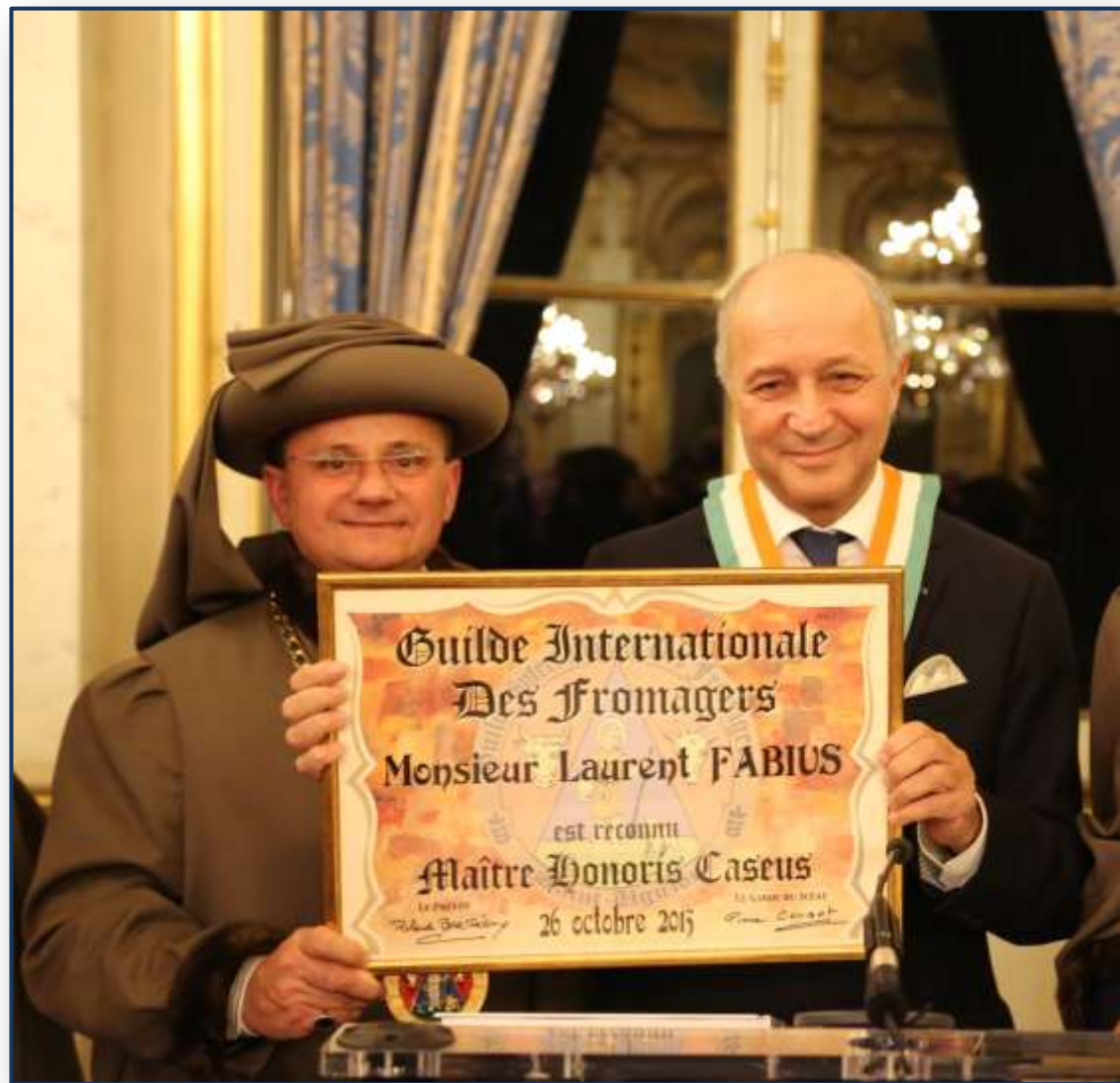
DER FRANZÖSISCHE AUSSENMINISTER MONSIEUR LAURENT FABIUS MAÎTRE HONORIS CASEUS GUILDE INTERNATIONALE DES FROMAGERS