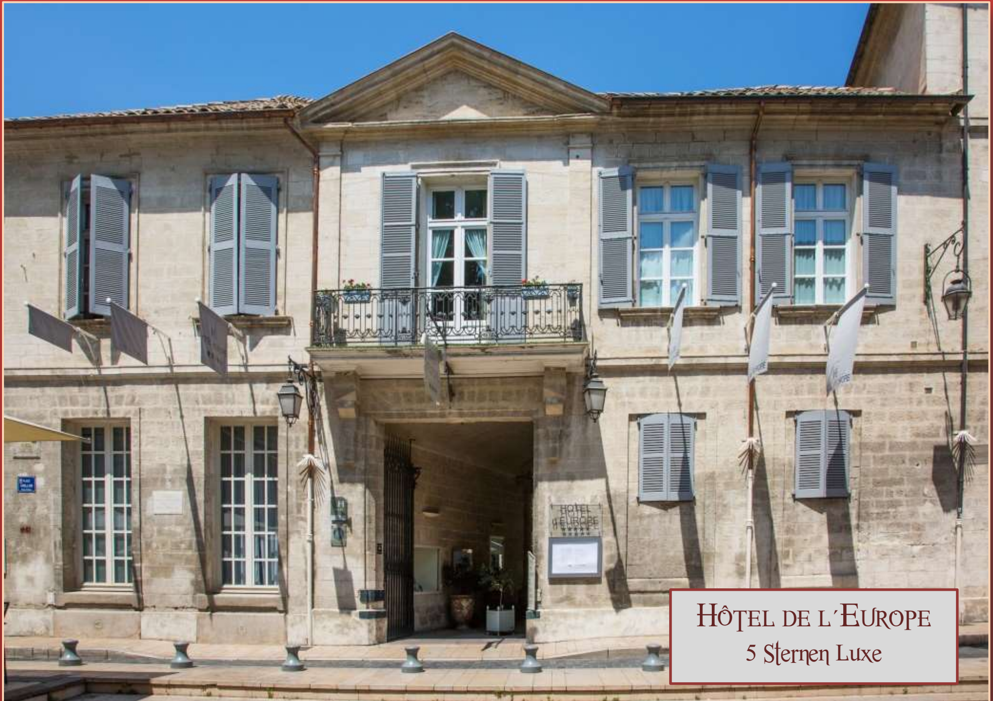
HÔTEL DE L'EUROPE 5 Sternen Luxe