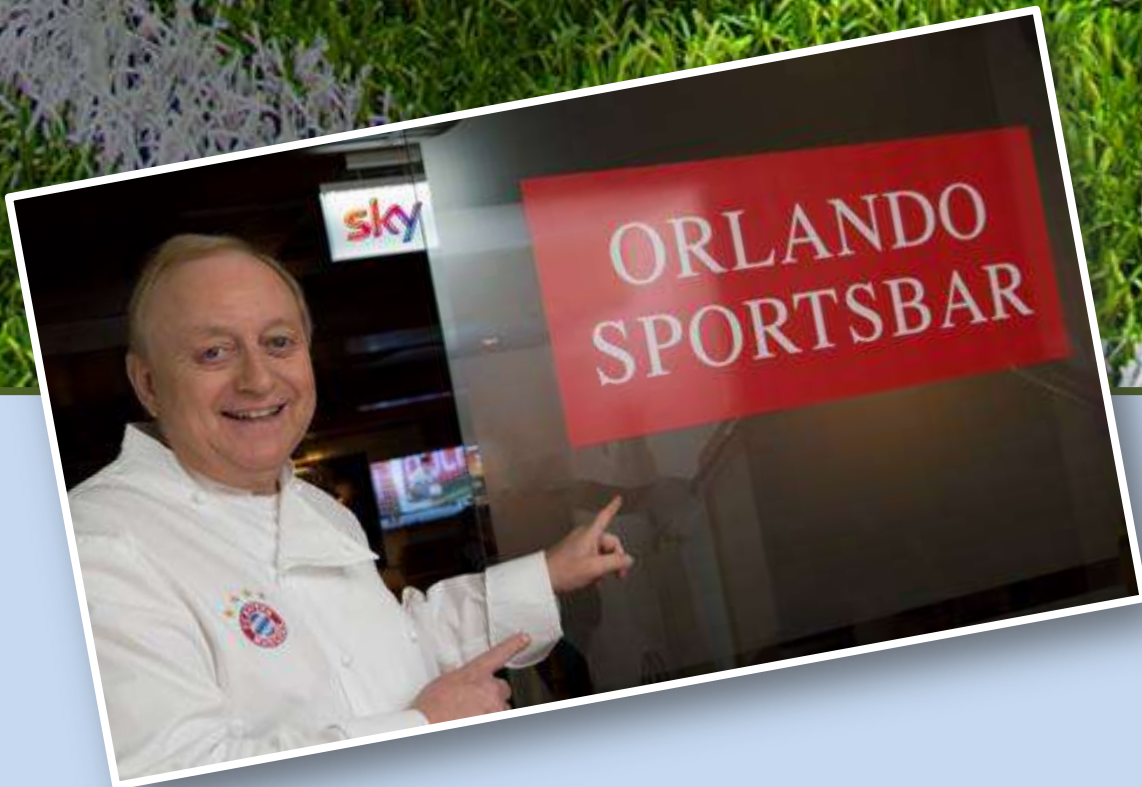
SCHUHBECK'S ORLANDO SPORTSBAR Am Platzl 4 - München