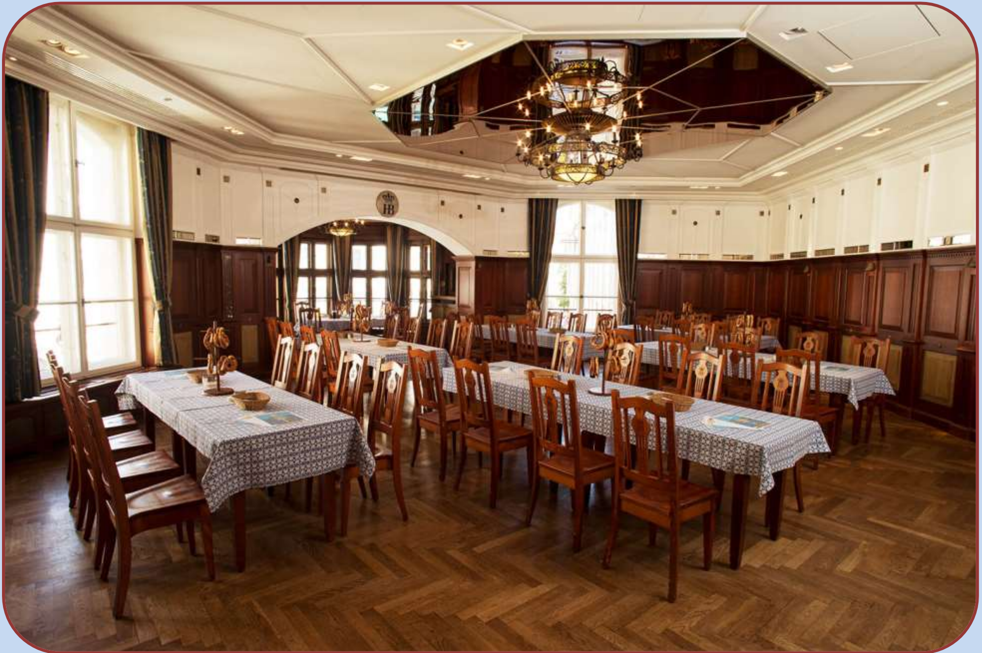
Jahreshauptversammlung Erkerzimmer Hofbräuhaus München