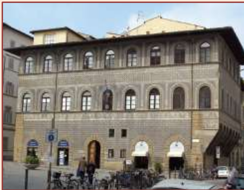
Der Palazzo Lenzi, Sitz des Franz. Institut und des Franz. Honorarkonsulat in Italien. Hier findet die JHV Club Italien statt.

Die Jahreshauptversammlung des Club Italien findet statt am 06. März 2020 im außergewöhnlichen Ambiente des Palazzo Lenzi. Dieser Palast im Renaissancestil befindet sich an der Piazza Ognissanti in Florenz. Erbaut im 15. Jahrhundert von der Familie Lenzi und der Familie Brunelleschi zugeschrieben. Florenz ist die Hauptstadt der Toskana und die Wiege der Renaissance in Italien mit einem künstlerischen Reichtum außergewöhnlich - Kirchen, Museen und Paläste - eingetragen als Weltkulturerbe.