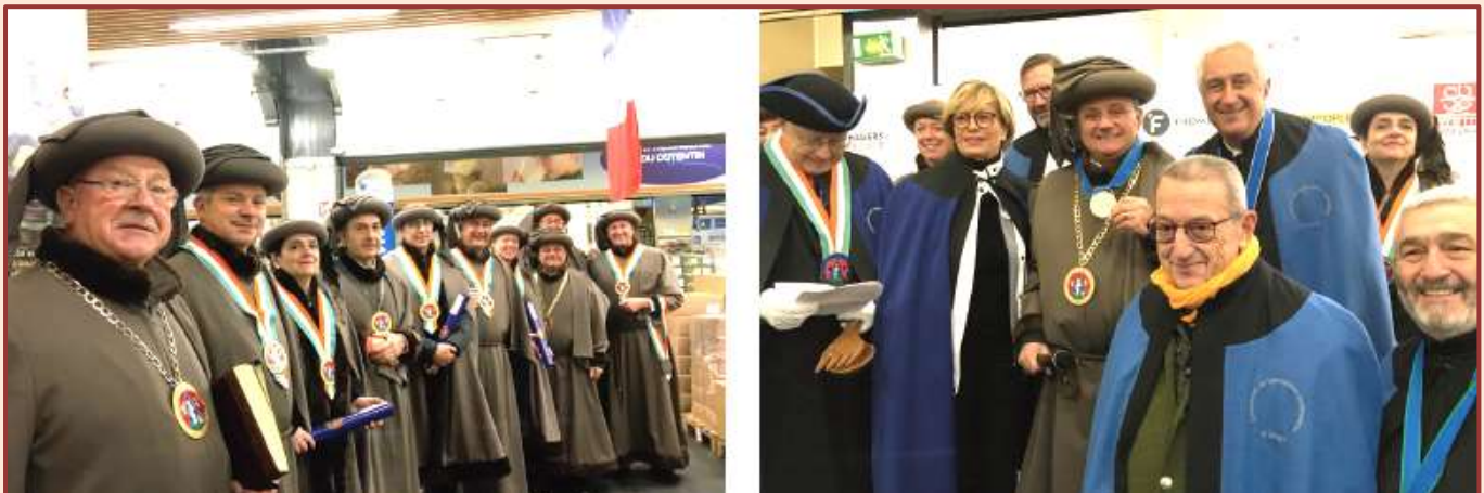
Zwei Kapitelsitzungen: Die Commanderie der Gastronomen – Botschafter von Rungis und die Guilde des Fromagers