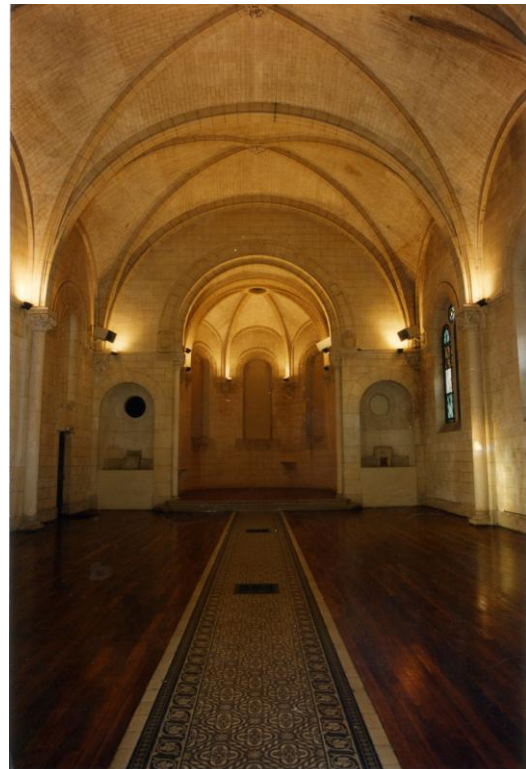
La chapelle Marquelet de la Noue