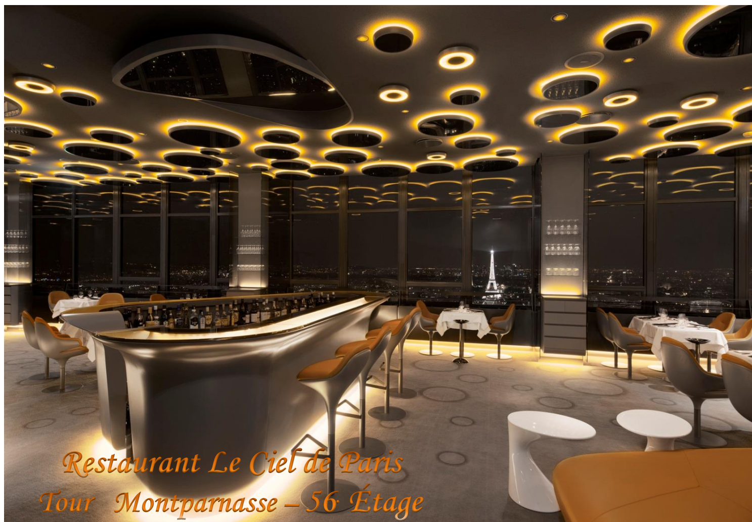
Restaurant Le Ciel de Paris Tour Montparnasse – 56 Étage

findet die 464. Kapitelsitzung mit Inthronisation im Restaurant « LE CIEL DE PARIS » statt.