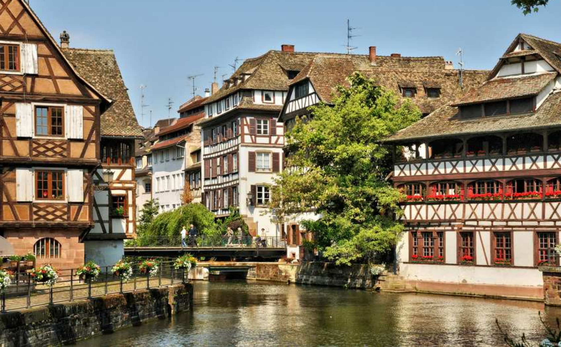
Das idyllische Gerberviertel in Straßburg – 16. und 17. Jhdt.