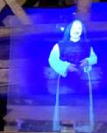
The monks, which sets us back.