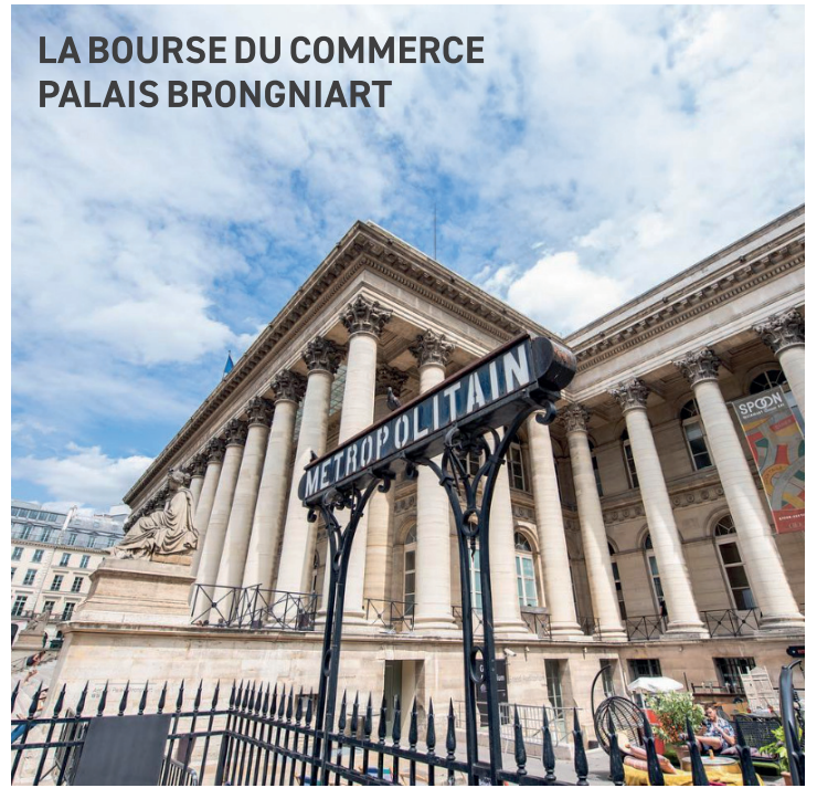
LA BOURSE DU COMMERCE PALAIS BRONGNIART